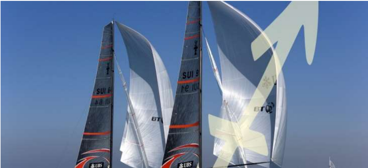
Schütze 21.11. - 21.12.2016

(24.11.2016/30.03.+04.08.2017). Das kollektive Wertebewusstsein beginnt sich jetzt überall zu wandeln und wird bis August 2017 ein vollkommen neues sein. Auch der Merkur geht am 23. November einen neuen Zyklus mit Saturn ein, was ebenfalls auf eine intensive Auseinandersetzung mit dem Wertewandel hinweist. Die laufenden Sternenfiguren bereiten uns schon auf das neue Jahr vor, indem sie uns durch die dunkle Jahreszeit geleiten und einladen, mit all unseren Liebsten, Freunden und Bekannten ehrliche, achtsame und innige Beziehungen zu pflegen. Der erste Adventssonntag am 27. November bringt uns schon in Kontakt mit Weihnachten, mit dem Schmücken unserer Räume, Häuser und Umgebungen. Und der Schütze-Neumond in ungenauem Aspekt zu Neptun in Fische aktiviert in uns die ureigene Wahrheitsfindung über uns selbst.