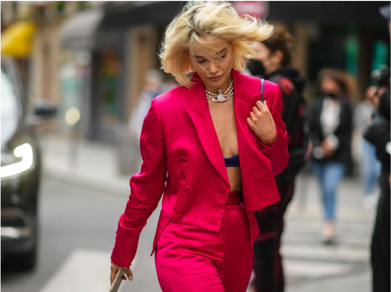
Viva Magenta /Pantone Color of the year 2023